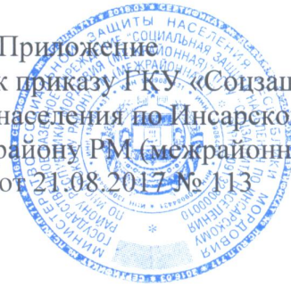
График личного приема граждан директором, заместителями директора в ГКУ «Соцзащита населения по Инсарскому району РМ (межрайонная)»

Приложение к приказу ГКУ «Соцзащита населения по Инсарскому району РМ (межрайонная)» от 21.08.2017 № 113